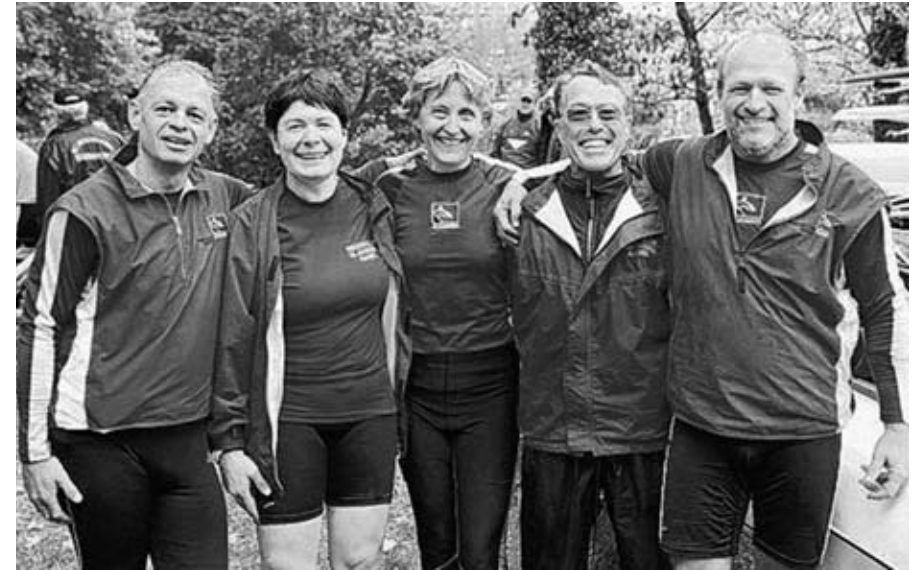
Das Schweizer Ruder-Quintett:

Fünf Boote waren in unserer Kategorie, Masters mixed Doppelvierer m. St. Gig D, gemeldet; Start (im Minuten Abstand) für uns um 11 Uhr 33. Zum Startplatz musste man 5 km rudern, das bedeutete dass wir spätestens um 11 Uhr ablegen sollten. Da die Damen vorher noch vor dem WC längere Zeit anstehen mussten erreichten wir dann ganz knapp in der Zeit liegend den Start. Dieser verlief allerdings etwas chaotisch. Von unseren Gegnern war keiner zu sehen; dafür ein paar Doppelzweier – und tatsächlich noch ein C-Vierer, der aber, wie sich später herausstellte, zur Kategorie C, also einer vor uns startenden, gehörte. Wir wurden nach den Zweiern aufgerufen und fuhren an. Zur Orientierung wie man im Rennen liegt war das natürlich schlecht. Waren wir schnell? oder langsam? Nach halber Strecke überholten wir einen der