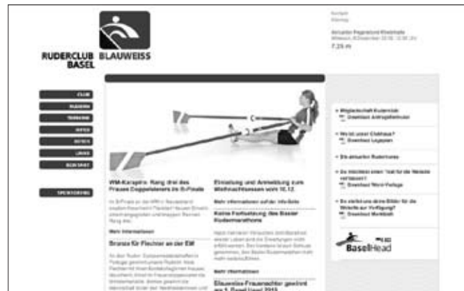
Unsere schöne neue Club-Website www.rcblauweiss.ch